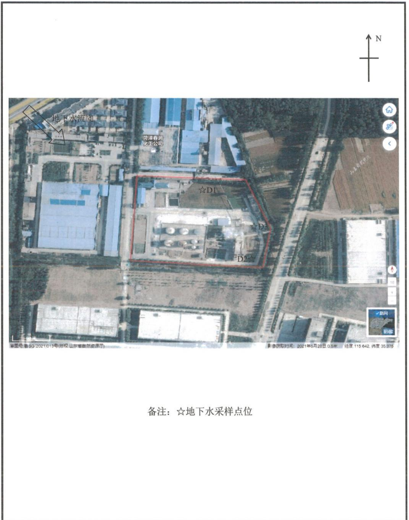
附图：厂区平面布置及布点示意图